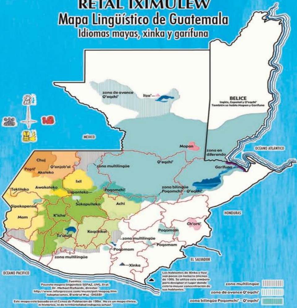
RETAL IXIMULEW Mapa Lingüístico de Guatemala Idiomas mayas, xinka y garífuna